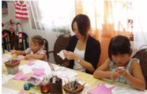
お母様方も真剣に取り組んで下さっています。