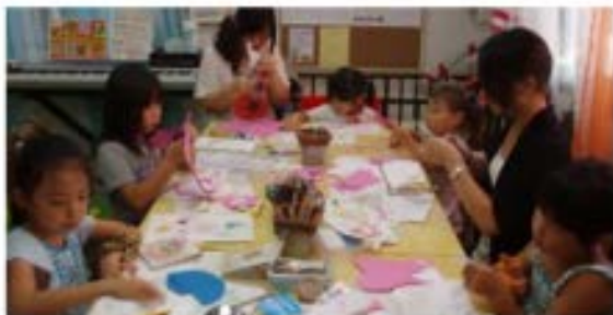
机の上も、にぎやかです✂️🌱