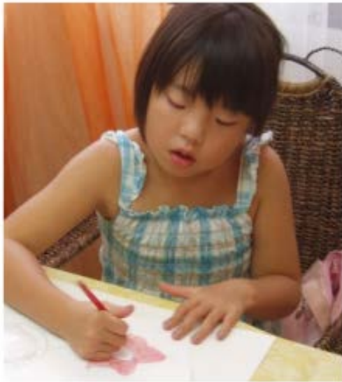
れのちゃん(小学校4年生)